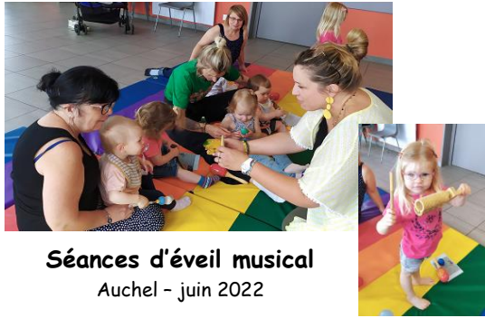
Séances d'éveil musical Auchel - juin 2022