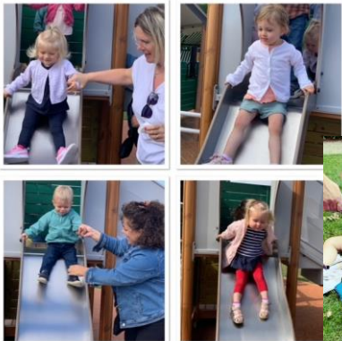
Parc Calonnix à Calonne-Ricouart