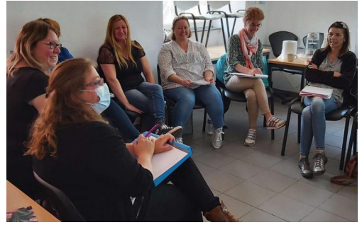
"Favoriser le jeu libre et aménager ses espaces" Formation d'assistantes maternelles - juin 2022