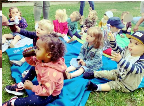
Jardin public à Barlin