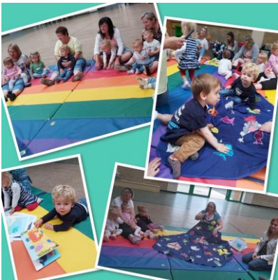
La Comté - le 30 juin