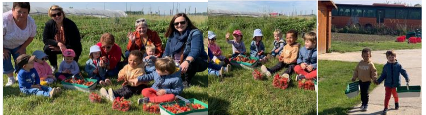
Séances de cueillette de fraises Jardin de Busnes - juin 2022