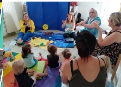
Heure du conte Bibliothèque d'Houdain 17 juin