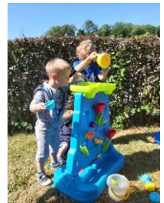
Marles-les-Mines, Calonne-Ricouart, Fresnicourt-le-Dolmen, Hersin-Coupigny